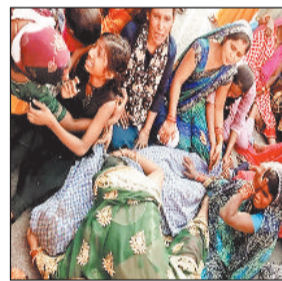
शव के पास विलाप करते परिजन।

जांजगीर चांपा। तेज रफ्तार पिकअप ने सायकल को जोरदार टोकर मार दी। हादसे में 14 वर्षीय बालक की मौके पर ही मौत हो गई। वहीं पिकअप सड़क किनारे पलट गई, जिससे वाहन के परखच्चे उड़ गए। हादसे के बाद आक्रोशित ग्रामीणों ने चक्काजाम कर दिया। घटना बलौदा थाना क्षेत्र के ग्राम बुचीहरदी की है। इस संबंध में मिली जानकारी अनुसार बुची हरदी