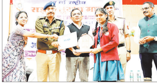
कलेक्टर एवं एसपी ने विजेताओं को किया पुरस्कृत।

महत्वपूर्ण है। हैलमेट एवं सीट बेल्ट का नियमित उपयोग, निर्धारित गति सीमा का पालन, राशे की हालत में वाहन न चलाना तथा वाहन चलाते समय मोबाइल फोन का प्रयोग न करना जैसे छोटे-छोटे कदम बड़ी दुर्घटनाओं को रोक सकते हैं। उन्होंने उपस्थित सभी लोगों से यातायात नियमों एवं सड़क सुरक्षा उपायों को अपने जीवन