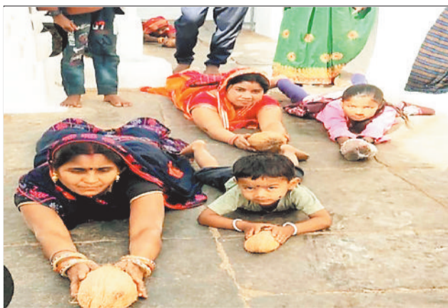
भुईयां नापते शबरीधाम जाते श्रद्धालु एवं लगा मेला।

शिवरीनारायण का माघी पूर्णिमा मेला रविवार 1 फरवरी से प्रारंभ होगा। श्रद्धा और भक्ति लिए हजारों श्रद्धालु महानदी जोंक और शिवनाथ नदी के संगम में डुबकी लगाएंगे। इसके लिए दूर-दराज से लोगों का आना शुरू हो गया है। वहीं श्रद्धालु लोट मारते शबरी के धाम में पहुंचे। इधर मेला के लिए शिवरीनारायण भव्य रूप से सज गया है। बर्तन, फल, कपड़े व सभी सामग्रियों की दुकानें लग चुकी हैं।