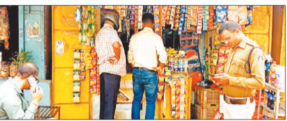
कोटपा एक्ट के तहत कार्रवाई करती पुलिस।