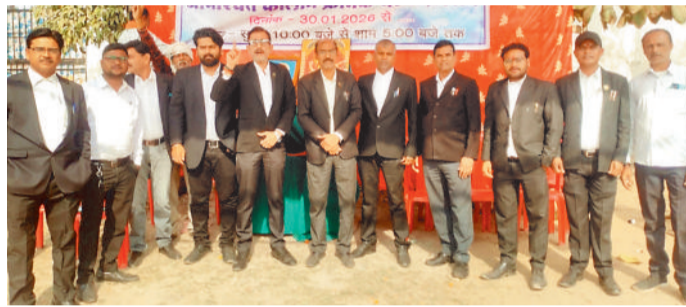
अनिश्चितकालीन धरना प्रदर्शन करते अधिवक्ता।

कटघोरा को जिला बनाए जाने की वर्षों पुरानी मांग एक बार फिर जोर पकड़ती नजर आ रही है। कटघोरा अधिवक्ता संघ ने आज से कटघोरा को जिला का दर्जा देने की मांग को लेकर अनिश्चितकालीन धरना-प्रदर्शन शुरू कर दिया है। अधिवक्ताओं के इस आंदोलन को लेकर क्षेत्र में राजनीतिक और सामाजिक हलचल तेज हो गई है।